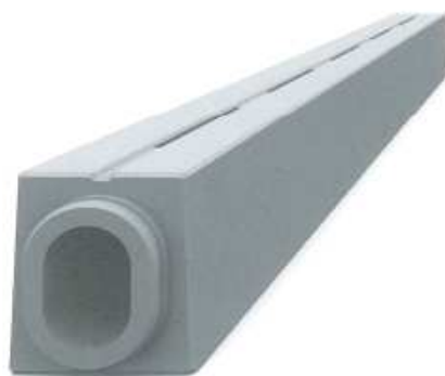
Schlitzrinnen Typ 20 RU Typ 20/30 U Typ 20/30 UI