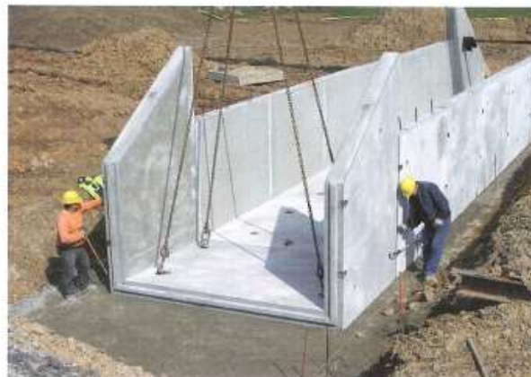
Bauwerke mit verschiedenen Anschlussmöglichkeiten