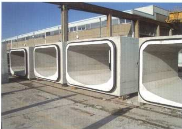
Rechteckprofile mit/ohne Trockenwetterrinne, in unterschiedlichen Abmessungen (LxBxH)