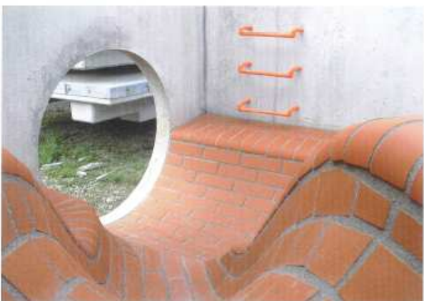
Bauwerke mit/ohne Gerinne, Ausführungen vier- oder mehreckig