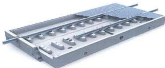
LKW-Auffangwanne nach DIBt- Zulassungs-Nr.: Z-74.3-36 in den Abmessungen (LxB): Varinate 1: 5,00 x 3,80 m Varinate 2: 7,50 x 3,80 m Sonderlösungen nach Kundenwunsch