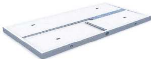
LKW-Auffangwanne nach DIBt- Zulassungs-Nr.: Z-74.3-35 in den Abmessungen: Länge: 5,00 bis 8,00 m Breite: 3,80 bis 4,00 m Sonderlösungen nach Kundenwunsch